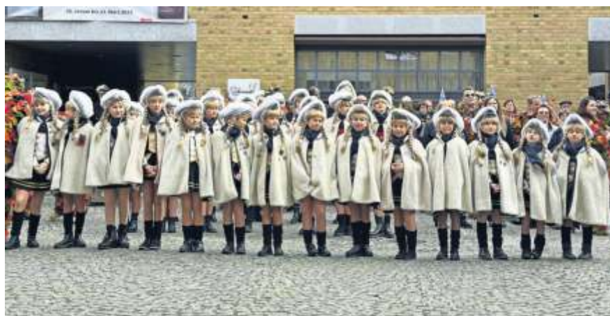
Die Narrenschar marschierte im Rathausinnenhof auf.

Das Motto des diesjährigen Rathaussturms erinnerte an die Gründung des FCC, des Fellbacher Carnival Clubs, der 2025 sein 44jähriges Jubiläum feiert. Das Quiz im Rathaushof war trotz des enormen Einsatzes der Rathausmannschaft und der bunten Outfits der Verteidiger nicht zu gewinnen. Mit der geball-