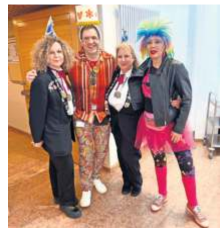
Ein letzter Kostümcheck.

Fellbach zusammen mit der als „Stadtgugga“ auftretenden Stadtkapelle ins Rathaus ein. Die Hits der 1980er mit „Girls wanna have fun“, „Rock me Amadeus“ und vielen an-