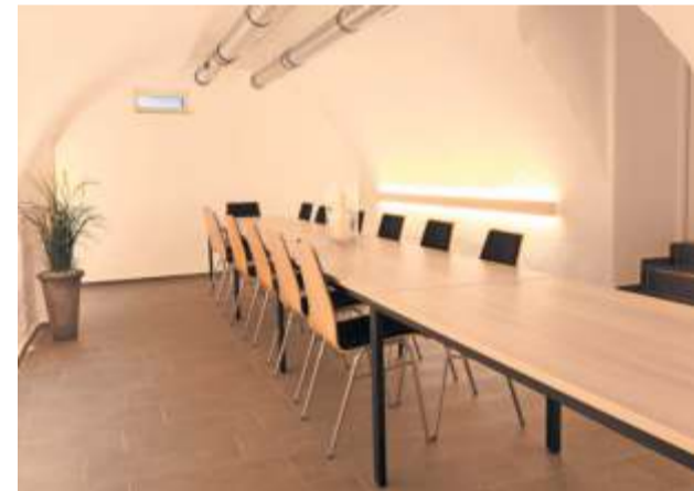
Ein Ort für Trauercafés und Vorträge

zungen sehr entlastend sein. Eine Bestattungsvorsorge sichert zudem die eigenen Wünsche finanziell ab und sichert die individuelle Selbstbestimmung. Das Vorgehen ist dabei sehr unkompliziert. Bei Schäfer und Roth Bestattungen wird dazu ein Bestattungsvorsorgevertrag abgeschlossen. Darin ist der Ablauf der eigenen Bestattung festgelegt – auf Wunsch bis ins letzte Detail. Ein optionaler Vertrag mit der Deutschen Bestattungsvorsorge Treuhand AG sichert zusätzlich die Kosten der Bestattung ab. Das dazu angelegte Geld ist im üblichen Rahmen als