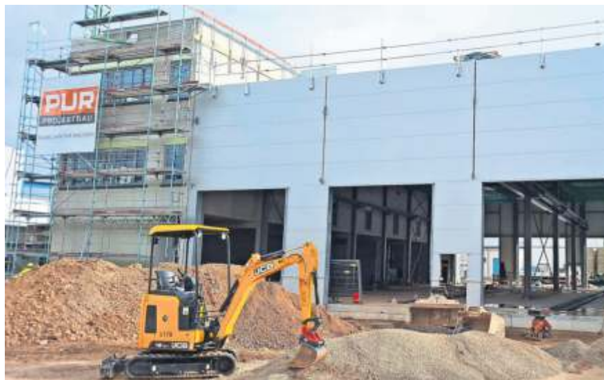
Der Erweiterungsbau des Unternehmens nimmt Formen an und ist ein Bekenntnis zum Standort Fellbach.