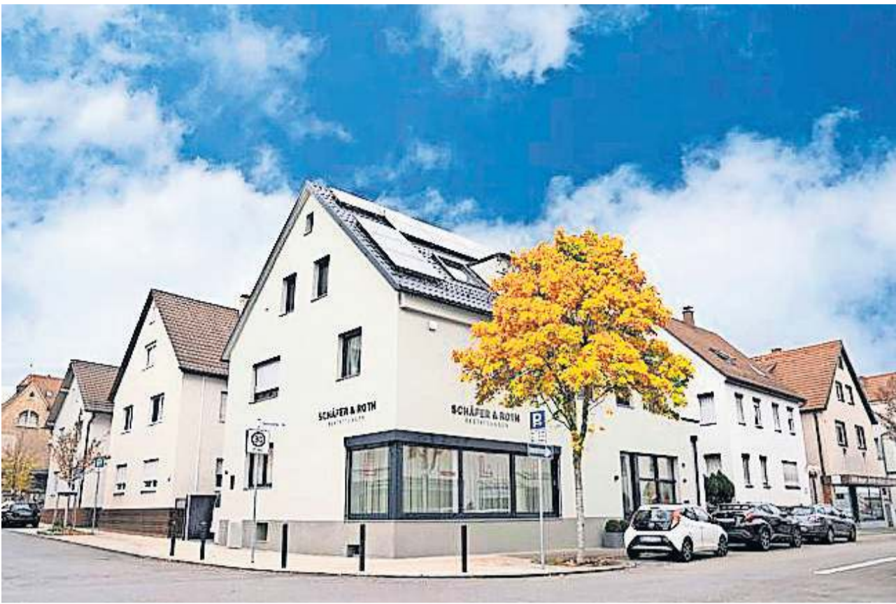
Die Fellbacher Zweigstelle von Schäfer und Roth liegt in der Cannstatter Straße 55.